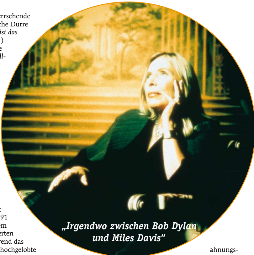
„Irgendwo zwischen Bob Dylan und Miles Davis“

freier für die herrschende geistig-moralische Dürre („In den 80ern ist das Herz gestorben.“) und produzierte „mein am schnellsten alterndes Werk“ „Dog Eat Dog“ – weil ihr niemand sonst kritisch genug schien. Allerdings schrieb sie orientierungslos auf der Suche nach zeitgemäßen Sounds Songs, denen der letzte Funke fehlte. Erst mit „Night Ride Home“ 1991 fand sie zu einem gitarrenorientierten Post-Folk, während das gleichermaßen hochgelobte „Turbulent Indigo“ 1994 ihre Karriere beenden sollte.